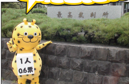
▲0.6票くんもパレードに参加!